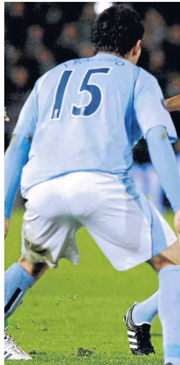
La participación en la Copa de la UEFA fue uno de los momentos claves de